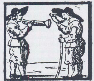
TROMPET EN HOOREN.