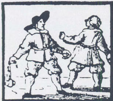
SLINGEREN EN WERPEN.