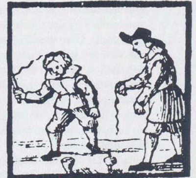
DEES TOPPEN EN NONNEN.