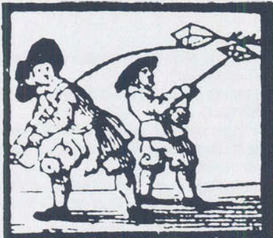
LOOPEN MET VLICHERS.

Rechtsboven twee kinderen die aan het 'koekerèllen' zijn. De prentenmaker laat ze 'toppen en nonnen'. Wie van u kent overigens déze zegswijze? (Uit: J.R. Schiltmeyer, Nederland in de Gouden Eeuw, Amsterdam z.j., p. 89)